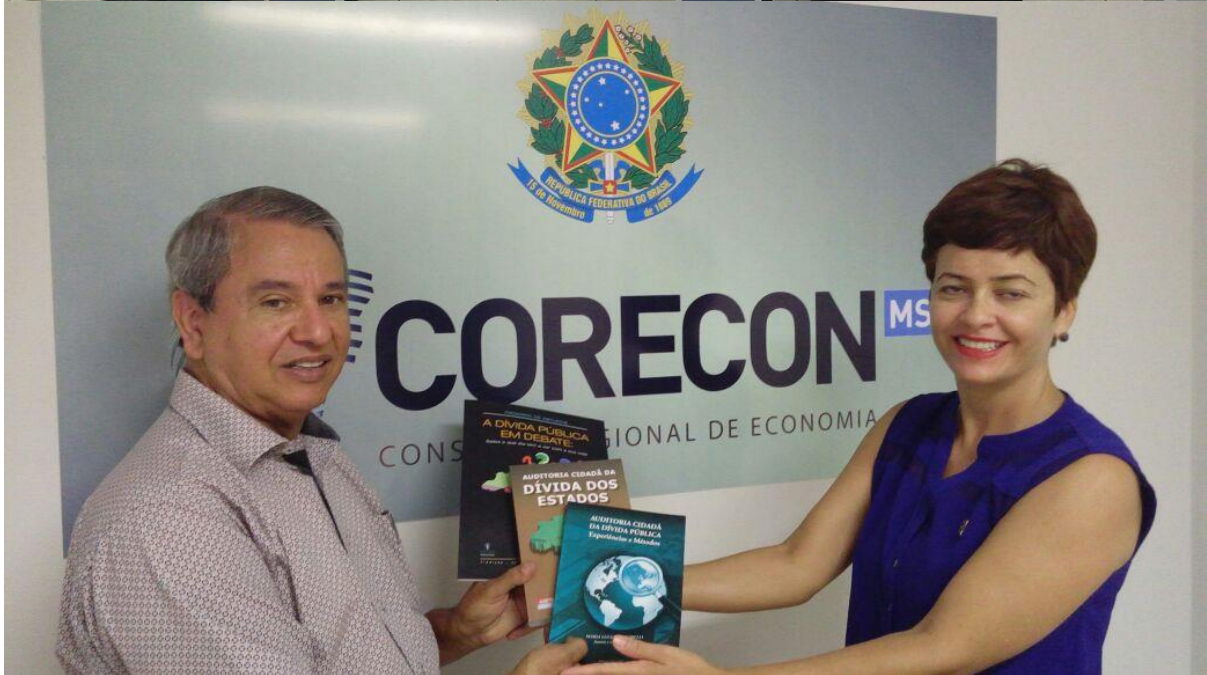
17/05/2016: entrega dos documentos solicitados pela ACD-MS na SEPLANFIC/PMCG foto abaixo