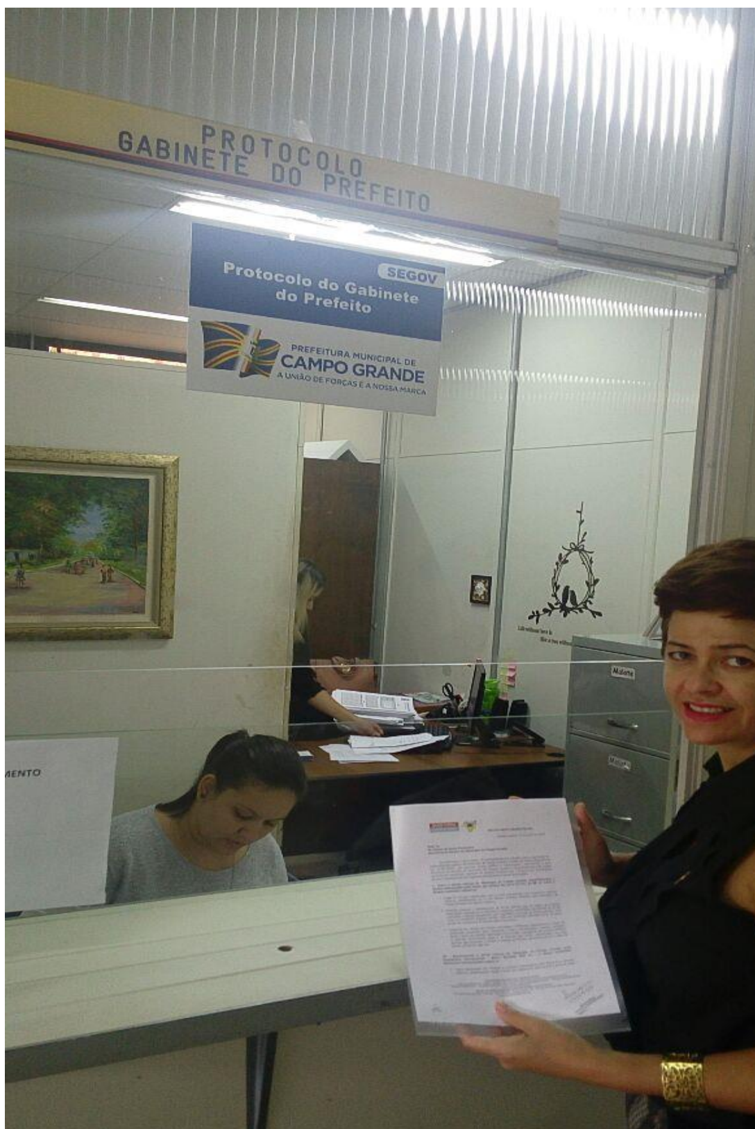
14/04/2016: formalização do Núcleo ACD-MS e I Reunião ;foto abaixo