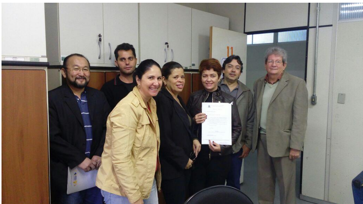
21/05/2016: VI Reunião Núcleo ACD-MS - Análise dos documentos fornecidos pela secretaria de Receita do Município de Campo Grande; foto abaixo