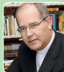
Dom Walmor Oliveira de Azevedo Presidente da CNBB