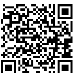
FERNANDA MELCHIONNA Deputada Federal PSOL-RS